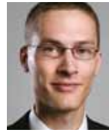
Platz 22: Kim Feustel