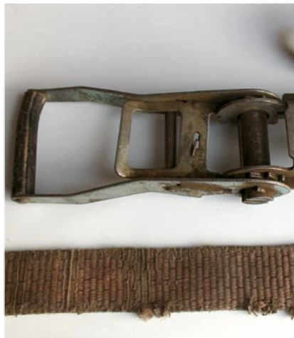
Ausmustern: Bei Einschnitten (größer 10%) ins Gewebe, fehlenden oder unleserlichen Etiketten sowie verformten Ratschen den Gurt entsorgen.