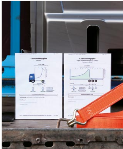
Entscheidungshilfe Lastverteilungsplan: Achslastüber- oder -unterschreitung beeinträchtigt das Fahr-, Brems- und Lenkverhalten des LKW.