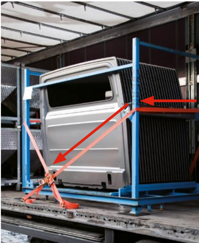
Schrägverzurrung: RHM-Matten und die senkrechte Sicherungskomponente der Verzurrung verhindern ein seitliches Wandern der Ladung.