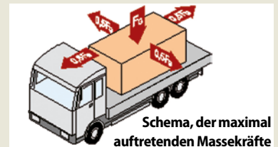
Schema, der maximal auftretenden Massekräfte